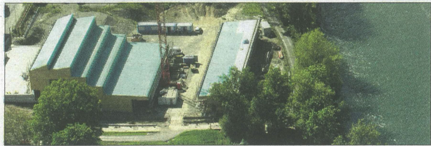
Neubau der IBB nähert sich der Vollendung