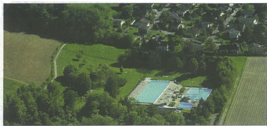
Die Badesaison hat begonnen