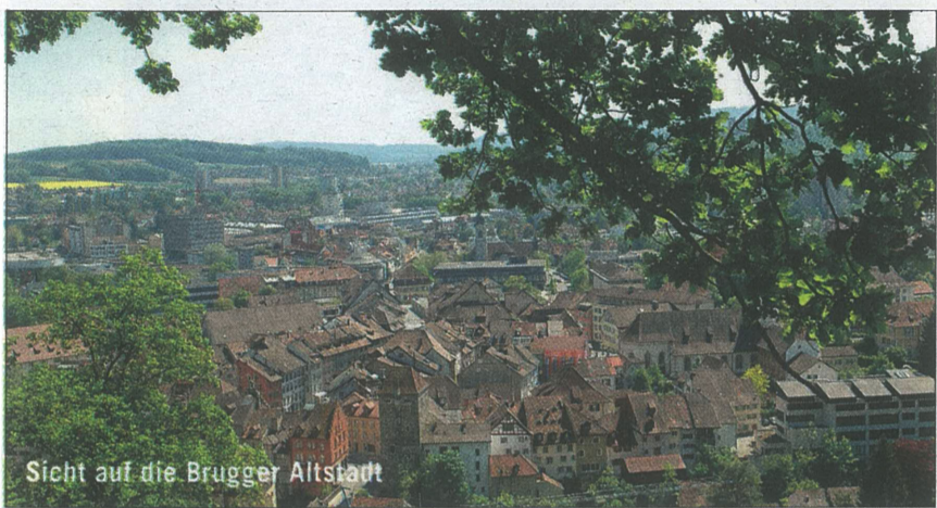
Sicht auf die Brigger Altstadt