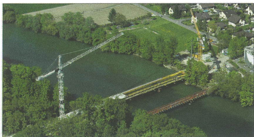
Die neue Brücke Vogelsang wird im Herbst eröffnet