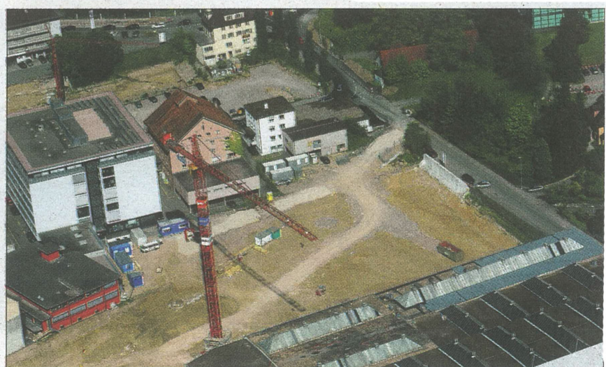
Vision Mitte: Areal Kabelwerke – vergangene Woche war Grundsteinlegung