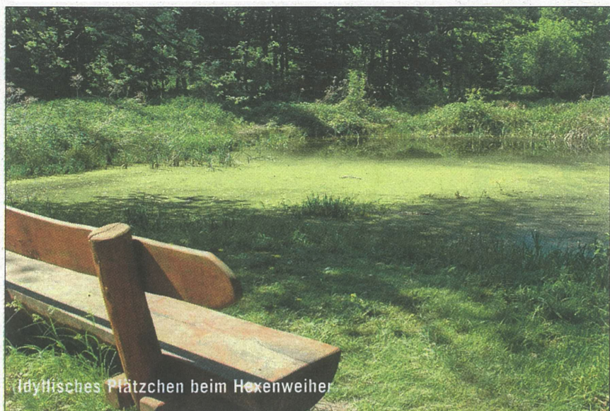
Idyllisches Plätzchen beim Hexenweiher