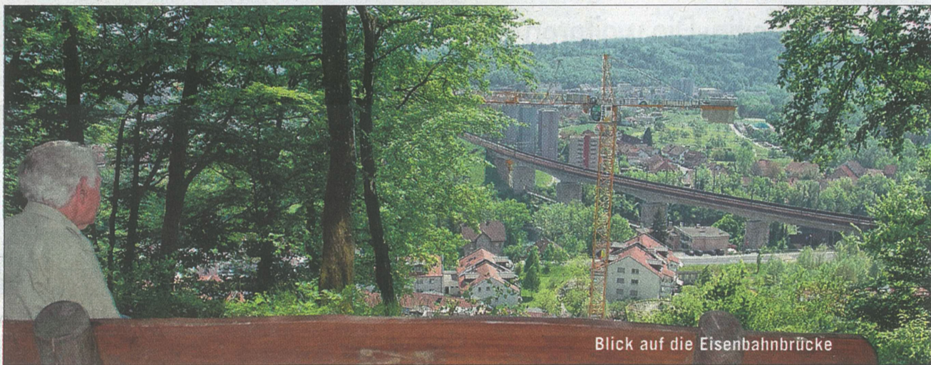
Blick auf die Eisenbahnbrücke