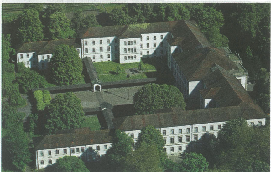
Schöner Spaziergang an heissen Tagen: Park der Klinik Königsfelden