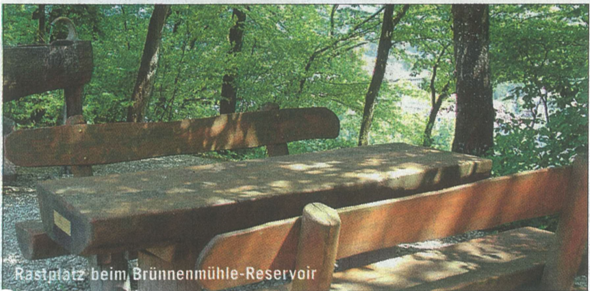
Rastplatz beim Brünnenmühle-Reservoir